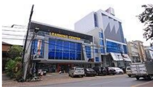
Kantor Pusat JNE berlokasi di Jakarta

Reputasi JNE EXPRESS mulai mencuat sebagai perusahaan ekspedisi terdepan di Indonesia di paruh kedua tahun 2000-an, seiring dengan tumbuhnya tren pemanfaatan internet untuk transaksi perdagangan dan jual beli secara daring di platform seperti Kaskus dan marketplace Multiply. Sebaran Agen JNE yang mudah ditemukan di kota-kota besar dan jam operasional dengan layanan 24 jam membuat JNE populer di kalangan pelaku bisnis online.