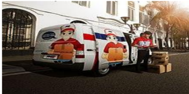
Blind Van JNE untuk pengantaran barang

Pada tahun 2017, JNE membangun E-fulfillment di beberapa cabang sebagai solusi bisnis terpadu bagi para pelaku Usaha Kecil, Mikro dan Menengah (UMKM), khususnya pemilik nama dagang, yang berjualan secara daring. Idenya, E-fulfillment membantu para pelaku UMKM fokus pada pengembangan produk dan marketing digital, sedangkan aktivitas logistiknya, mulai dari manajemen pergudangan, stok barang, pemilahan dan pengemasan sampai pengantaran barang ke tangan pelanggan, ditangani oleh JNE.