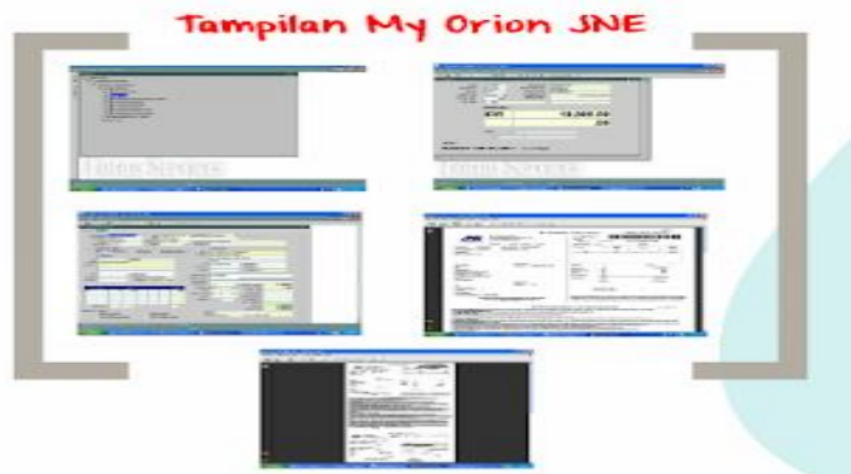
Gambar 4.1.5 Database JNE