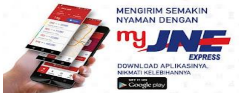
Gambar 4.1.6 Aplikasi JNE

bagian keuangan pun tidak perlu meng-input ulang data untuk dijadikan invoice. Tinggal masuk ke sistem dan dicetak, semua sudah terekam. Selain My-Orion JNE juga mempunyai aplikasi yang dapat digunakan oleh pelanggan yaitu My JNE.