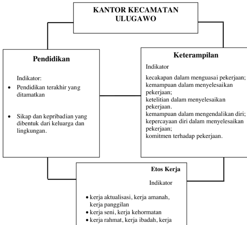
Gambar 2.1 Kerangka Berpikir

Untuk menghubungkan masalah yang ada pada penelitian, maka perlu dibuat kerangka berpikir sebagai dasar pedoman penelitian ini. Kerangka berpikir dimaksud akan mengarahkan peneliti untuk menemukan data dan informasi dalam penelitian ini dengan tujuan memecahkan permasalahan yang telah diuraikan sebelumnya, kerangka berpikir dalam penelitian ini sebagai berikut: