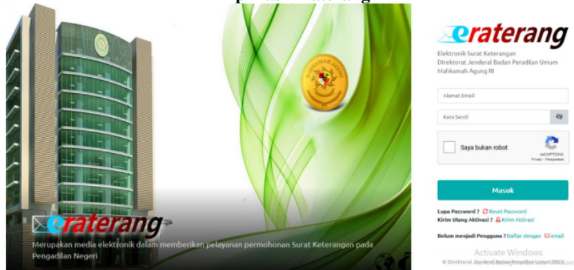
Gambar 4.2 Aplikasi Eraterang