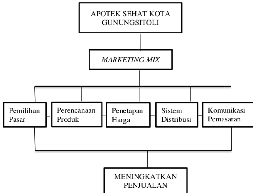
Gambar 2.1 Kerangka Berpikir

Menurut Sugiyono (2019: 95) Kerangka berpikir yang tepat dan baik mampu menjabarkan dengan teori pertautan antara variabel yang nantinya di teliti. Secara teori perlu dijabarkan hubungan antar variabel independen dan variabel dependen