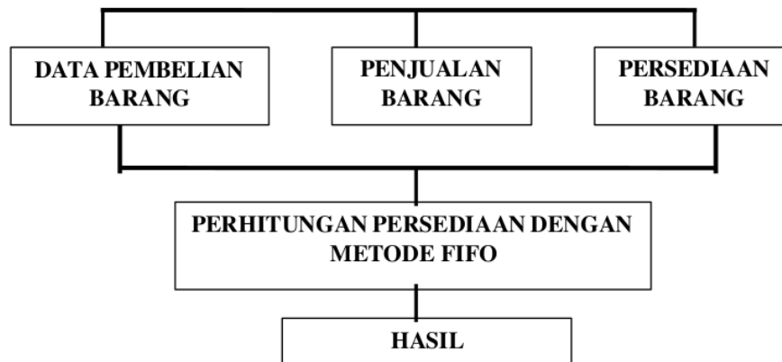
Gambar 2.1 Kerangka Berpikir Penelitian

Berdasarkan Gambar 2.1 tersebut diatas menjelaskan bahwa penelitian ini dilakukan di UD. Caritas Market Kota Gunungsitoli, yaitu menganalisis Perhitungan Persediaan dengan Metode FIFO dan yang di gunakan dalam penelitian ini yaitu daftar pembelian barang, daftar penjualan barang dan daftar persediaan barang. Dimana dari daftar tersebut dibutuhkan untuk menganalisis perhitungan persediaan dengan metode FIFO.