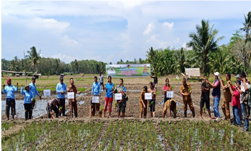
Gambar 4.1 Intensifikasi Padi Sawah Tahun 2024