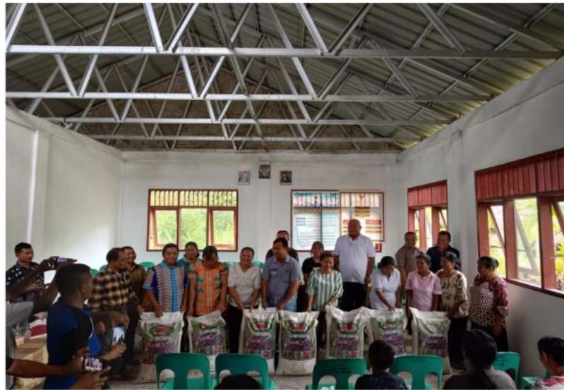
Gambar 4.1 Penyerahan Pupuk Kepada Kelompok Tani