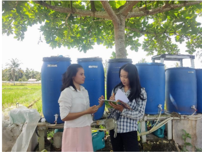
Gambar 4. 6 Wakasek Kesiswaan SMA Abdi Pusaka Indonesia