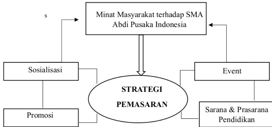
Gambar 2. 1 Kerangka Berpikir