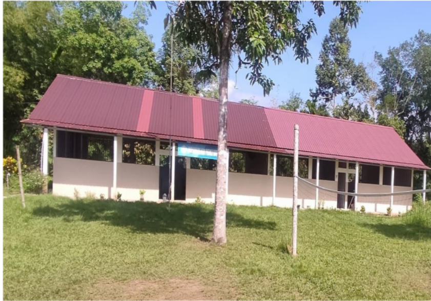
Gambar 4. 2 Halaman Sekolah SMA Abdi Pusaka Indonesia

Pembahasan mengenai strategi pemasaran di SMA Abdi Pusaka Indonesia menyoroti pentingnya merancang dan mengimplementasikan rencana komprehensif untuk mempromosikan layanan pendidikan. Dalam konteks ini, strategi pemasaran bertujuan untuk meningkatkan calon siswa baru serta meningkatkan jumlah pendaftar di SMA Abdi Pusaka Indonesia. Strategi ini mencakup berbagai metode, mulai dari distribusi brosur hingga penggunaan media sosial, dan bertujuan untuk mencapai tujuan pemasaran dengan cara yang efisien dan efektif. “Tujuan pemasaran adalah untuk membangun keyakinan pelanggan terhadap lembaga pendidikan, sehingga dapat menciptakan loyalitas pelanggan terhadap lembaga tersebut.” (Ashari, 2023:51) Evaluasi terus-menerus dan adaptasi strategi pemasaran sangat penting untuk memastikan daya tarik sekolah dan memenuhi kebutuhan serta ekspektasi masyarakat.