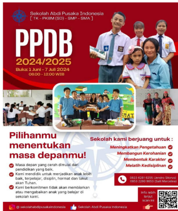
Gambar 4. 4 Brosur PPDB Tahun 2024 SMA Abdi Pusaka Indonesia