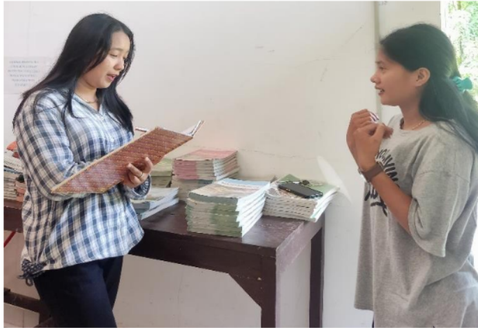
Gambar 4.7 Panitia PPDB SMA Abdi Pusaka Indonesia Tahun 2024

SMA Abdi Pusaka Indonesia telah menggunakan strategi pemasaran yang efektif dengan cara berkunjung langsung ke sekolah-sekolah yang memiliki calon peserta didik baru. Strategi ini memungkinkan SMA Abdi Pusaka Indonesia untuk menjalin hubungan langsung dan personal dengan calon siswa serta orang tua mereka, yang dapat meningkatkan minat dan kepercayaan. Namun, seiring dengan perkembangan teknologi dan tren media sosial, sekolah ini juga mulai menerapkan strategi pemasaran baru dengan memanfaatkan platform media sosial seperti Facebook untuk menyebarkan informasi dan brosur tentang sekolah mereka.