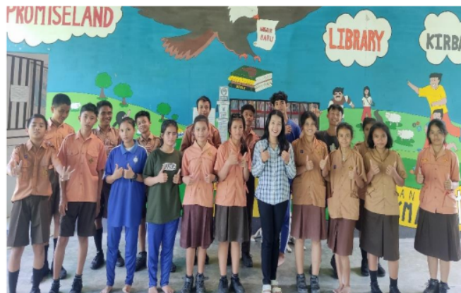
Gambar 4. 5 Siswa siswi sekolah SMA Abdi Pusaka Indonesia Sumber : Dokumentasi Peneliti, 2024

gereja tetapi juga menargetkan kelompok orang tua yang sering mengandalkan rekomendasi dari pemimpin dan anggota organisasi keagamaan. Selain itu, tempat ibadah sering menjadi pusat kegiatan sosial dan pendidikan, menjadikannya platform ideal untuk menjangkau keluarga yang mencari pilihan pendidikan yang sesuai dengan nilai-nilai mereka. Dengan menunjukkan komitmen sekolah terhadap nilai-nilai moral dan etika, kunjungan ke tempat ibadah dapat membantu membangun reputasi positif dan menarik minat orang tua untuk mendaftarkan anak-anak mereka di sekolah tersebut.