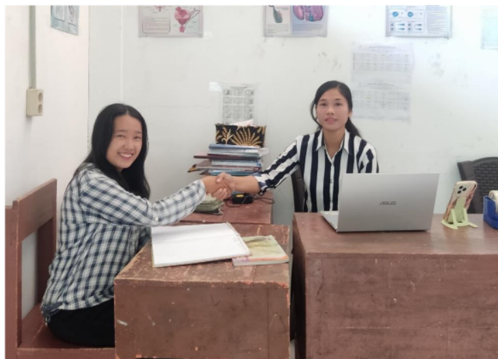
Gambar 4.3 Kepala Sekolah SMA Abdi Pusaka Indonesia

Strategi pemasaran adalah rencana komprehensif yang dirancang untuk mempromosikan produk atau layanan kepada target audiens dengan tujuan mencapai tujuan bisnis tertentu seperti meningkatkan kesadaran merek, menarik pelanggan baru, dan meningkatkan penjualan. Sejalan dengan yang di sampaikan (Haque-Fawzin, et Al., 2022:9)