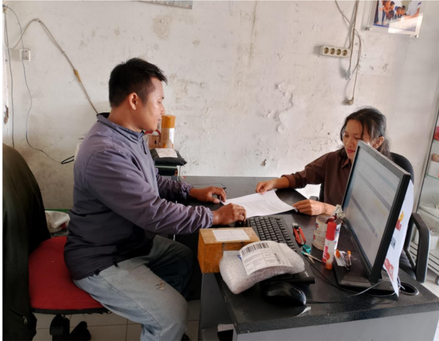
Foto Dokumen Penyebaran Angket