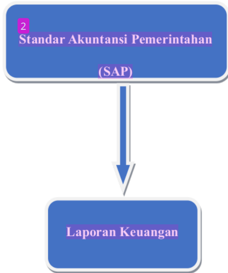
Gambar 2.1 olahan penulis, 2024