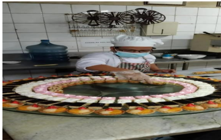
Gambar 4.1 Story/ cerita