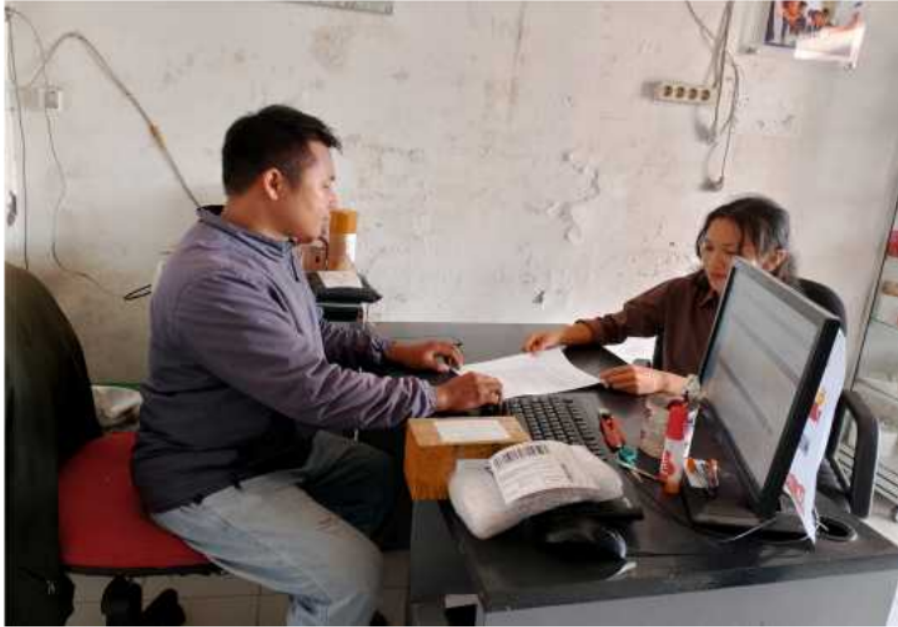
Lampiran 3 Foto Dokumen Penyebaran Angket