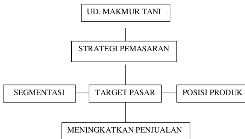
Gambar 2. 1 Kerangka Berpikir

Kerangka berpikir adalah penjelasan tentang hubungan antar variabel yang disusun berdasarkan landasan teori dan penelitian terdahulu yang relevan. Kerangka berpikir merupakan model konseptual yang menggambarkan hubungan antara variabel-variabel yang akan diteliti.