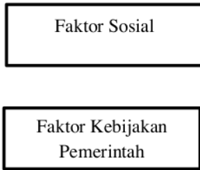
Gambar 1.2 Kerangka pemikiran teoritis