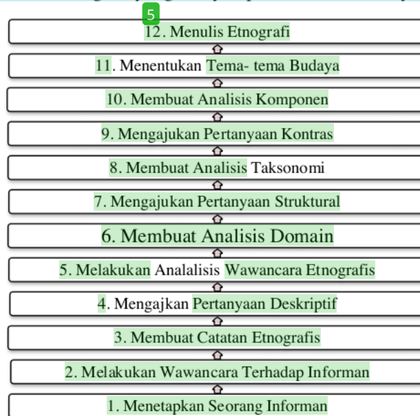
Gambar 3.11 Tahapan Pendekatan Etnografi

Salah satu cara terbaik menulis etnografi adalah dengan membaca etnografi lain. Pilihlah etnografi yang menyampaikan makna budaya lain.