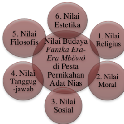
Gambar 1.3 Kerangka Nilai Budaya