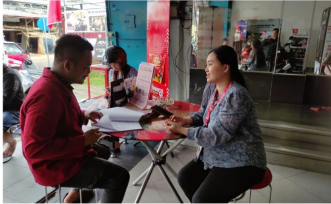
FOTO DOKUMENTASI WAWANCARA KEPADA INFORMAN