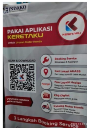
Gambar 4.2 Aplikasi “Keretaku”

7 Berdasarkan hasil wawancara dan hasil observasi peneliti, peneliti dapat menarik kesimpulan bahwa model bisnis perangkat lunak sebagai layanan digital dapat membantu PT. Kencana Mulia Abadi dalam mempertahankan kesetiaan konsumen dengan menyediakan layanan berbasis perangkat lunak kepada konsumen. Dengan menggunakan model bisnis perangkat lunak yaitu aplikasi “Keretaku” sebagai layanan digital, PT. Kencana Mulia Abadi dapat meningkatkan interaksi, kenyamanan, dan kepuasan konsumen. Hal ini akan membantu mempertahankan kesetiaan konsumen dan membangun hubungan jangka panjang dengan perusahaan. Berikut gambar aplikasi “Keretaku” yang digunakan oleh PT. Kencana Mulia Abadi, sebagai berikut: